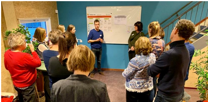
trui en Digna rechts, in de groene trui

Prinses Margrietschool (Zuilen), De Boemerang (Ondiep), obs De Panda en Het Schateiland (Kanaleneiland), de Mattheusschool, Op Dreef, obs Overvecht, De Schakel, de Marcusschool (Overvecht) en Op Avontuur (Lunetten) kozen elk een eigen invalshoek om hun onderwijs in begrijpend lezen en woordenschat te versterken. Bij de bekende WOU-posters vertellen zij over hun aanpak.